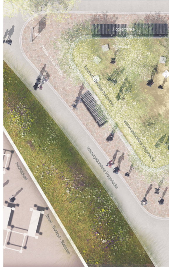
DETAIL M 1:50 Treffpunkt im Park